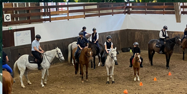
Des petits et grands cavaliers réunis !