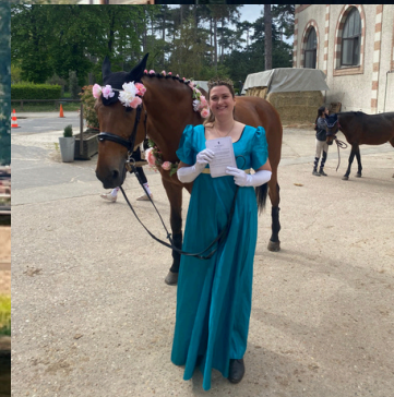
De jolis costumes au Modèles et Allures