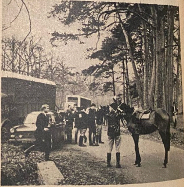
Chevaux et cavaliers à un des points de ralliement.

Merci aussi à Choco B.N., Mouët et Chandon, la Société Ricard, Le Figaro , les cigarettes John Sylver, qui ont si aimablement fourni les coupes, les récompenses et les dossards. Merci enfin à la Société Anonyme d'Application Electrique pour son service de transmissions qui a permis la rapidité des relations durant les épreuves.