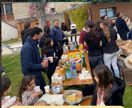
Pot des cavaliers