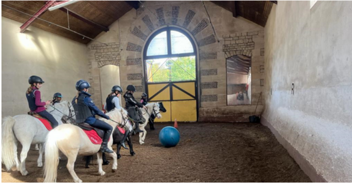
Grand match de Foot Poney au Touring !