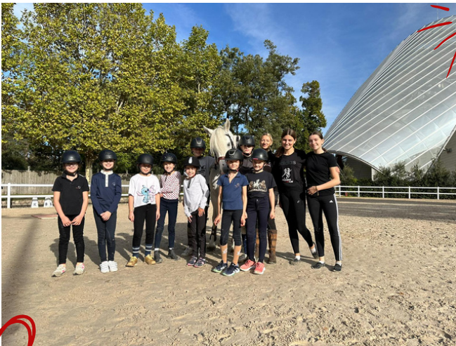
Voltige au soleil !